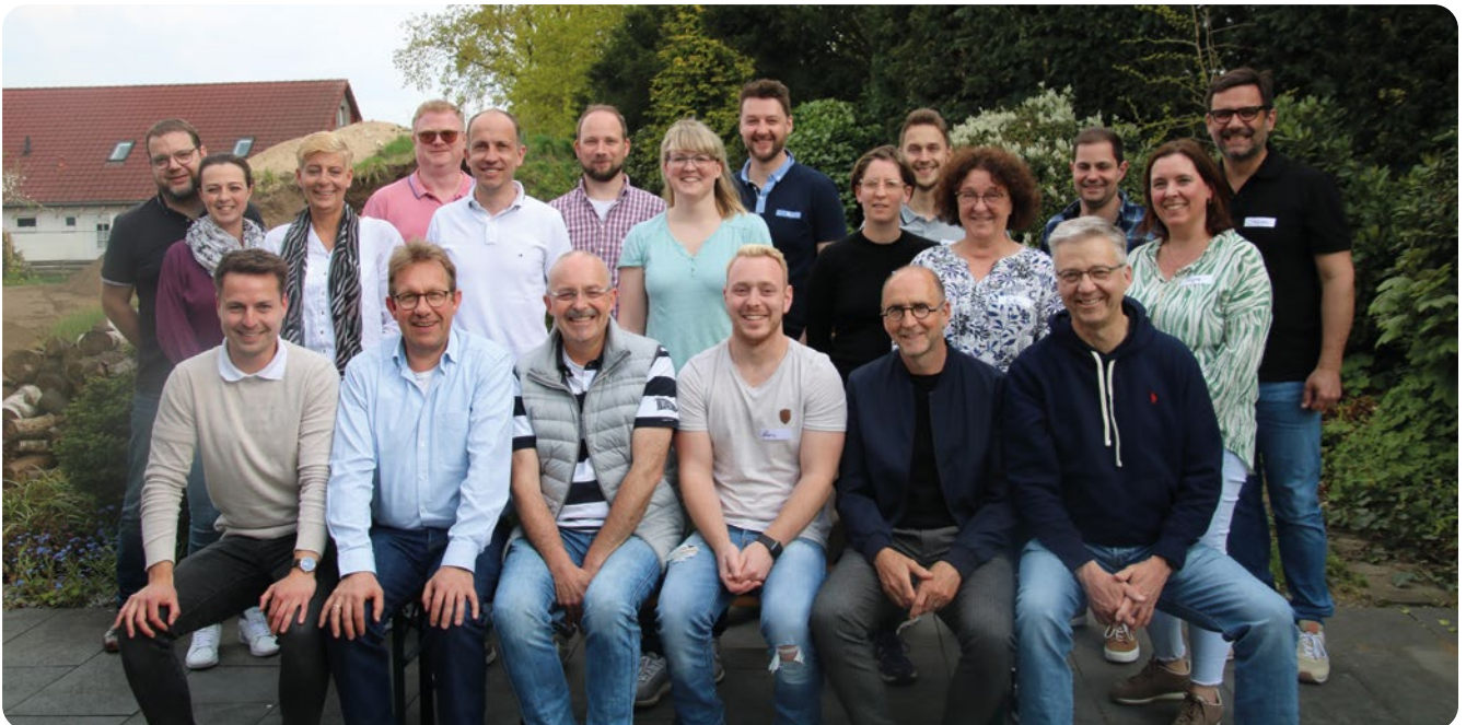
~ 01 Teilnehmer des diesjährigen Netzwerktreffens Zahntechnik 2025: Ketterling Dental-Technik aus Berlin, Jung Dental aus Kaltenkirchen, Zahntechnik Jochen Graf aus Monschau, Creativ Dental aus Lutherstadt-Wittenberg, Busse Zahntechnik aus Detmold, Zahntechnische-Werkstätte van Acken aus Borken und H+H – Das Dentalstudio aus Groß Hesepe

Seit beinahe zehn Jahren steht das Netzwerktreffen jedes Jahr im Kalender der Laborinhaber. Der Fokus lag schon früh auf den heute sehr aktuellen Themen „Fachkräftemangel“ und Veränderung der zahnärztlichen Landschaft. „Wie will die nächste Generation Zahnärzt:innen arbeiten?“